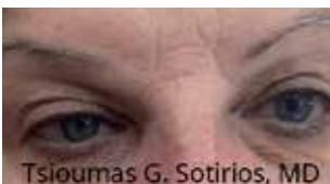
dopo: due sedute, check-up dopo due mesi. after: two sessions, check-up two months later.

www.softsurgery.org www.gruppogmv.com www.plexr.it www.ofthalmoplastiki.gr