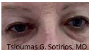
prima / before

WARNING! The form of patented, safe and effective microplasma can be obtained only with the Plexr® device. Anyone who wants to undergo the treatment of non-invasive and non-surgical blepharoplasty (or also other treatments possible with microplasma) must check the Plexr® logo on the device. A list of certified doctors can be found online.